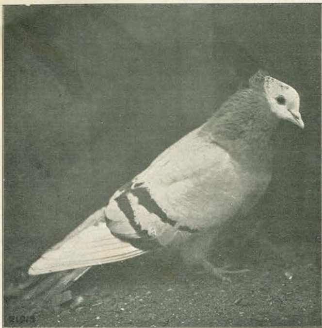
BLAUWE GEMONNIKTE OF RIJNLANDSCHE RINGSLAGER C 10371

Deze vogel van den heer W. de Groot werd gefotografeerd vlak na den rui, toen de slagpennen nog onbeschadigd waren. Bij actieve dieren zijn de slagpennen tegen den zomer vrijwel geheel afgesleten, zooals de andere afbeeldingen dat ook laten zien.