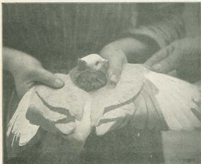
DE VERSLETEN „VLUCHT” VAN EEN RIJNLANDSCHE RINGSLAGER C 10394

De Ringslagers vormen een zeer oud ras, dat we reeds op een der doeken van Jan Steen vinden afgebeeld. Waarschijnlijk zijn deze dieren in de 16e of 17e eeuw uit het Verre Oosten tot ons gekomen. In teekening herinneren