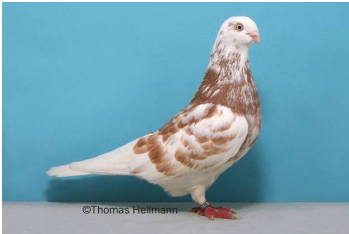
Boven: Een rood bonte Memeler.

* Gemazerd moet men niet beschouwen als zoomtekening; de tekening is ook niet zo regelmatig als bij de gezoomde rassen; het Duitse woord ' gemasert ' betekent eigenlijk gevlamd of geaderd.