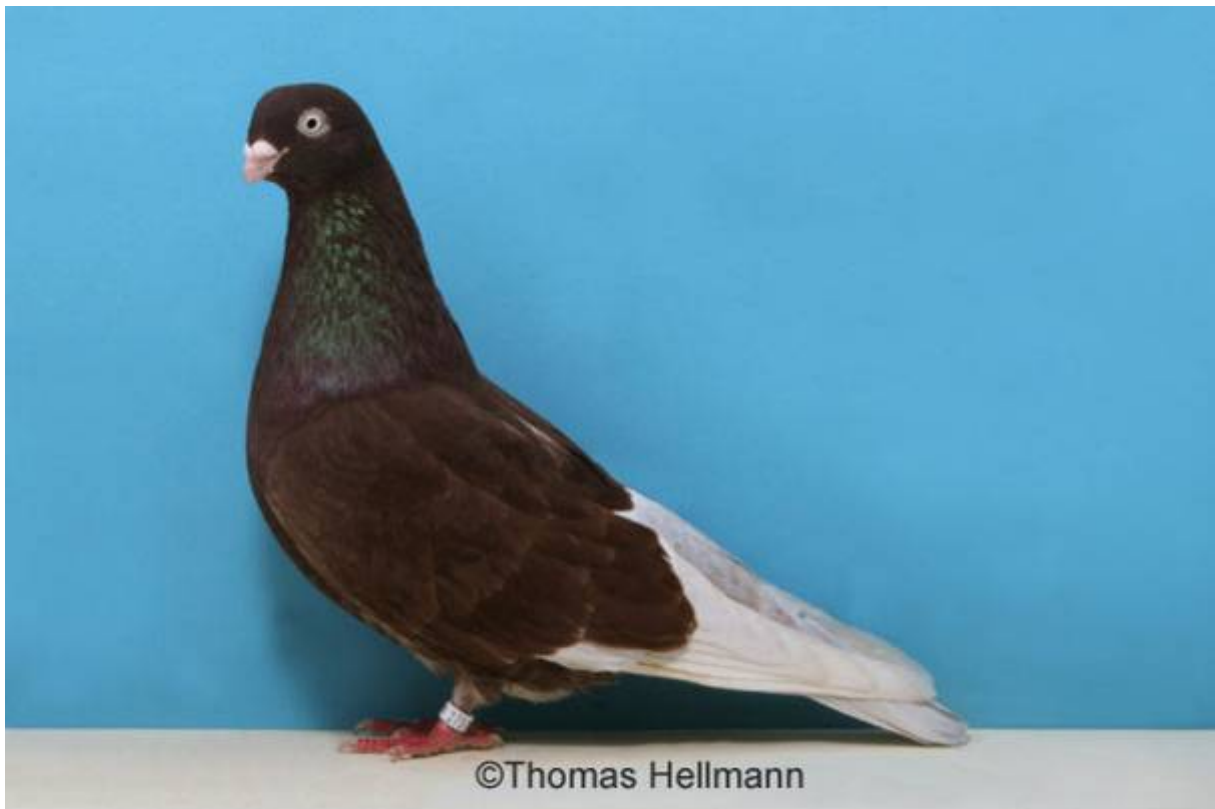
Boven: Een rood-witpen witstaart. Onder: Een zwart-witpen.