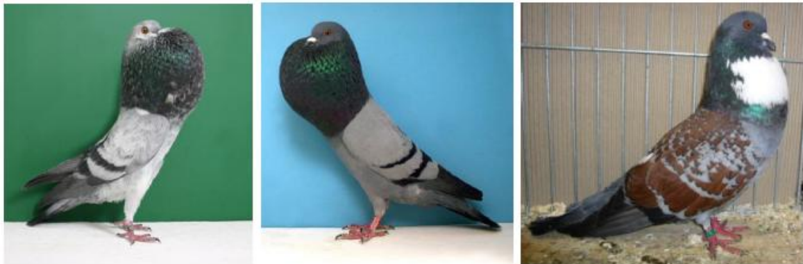
Fig. 322: Horseman Pouter blue grizzle (Joe Powers), Silesian Pouter blue bar and Cauchois bronze laced

70 geanalyseerde duivenrassen in een studie aan de Universiteit van Utah, zie voor details http://www.taubensell.de/molekulargenetische_studie_von_haustauben.htm .